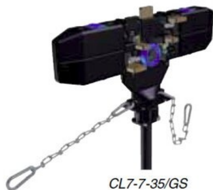
Gliding shoe with wheel set for type 'GS'-collector trolleys