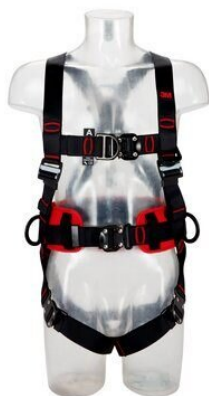
Work positioning D-ring